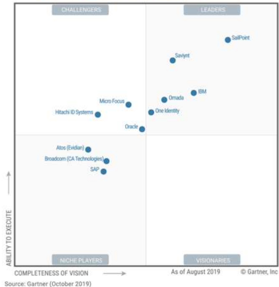
Figure 1. Magic Quadrant for Identity Governance and Administration