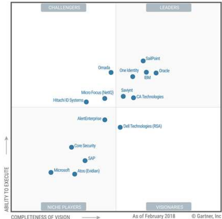
Figure 1. Magic Quadrant for Identity Governance and Administration

Разделение по 4 группам, но отличие в лидерах не определено